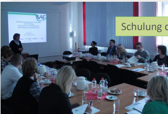
Schulung der Arbeitsmarktakteure