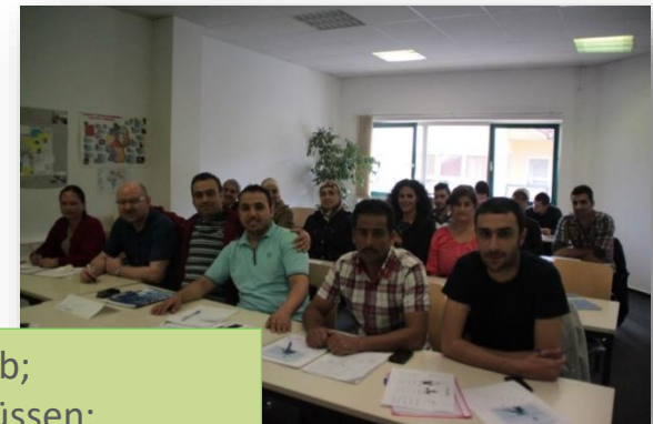
Ausbildung in Schule und Betrieb; Erlangung von allg. Schulabschlüssen; Klärung von rechtlichen Rahmenbedingungen