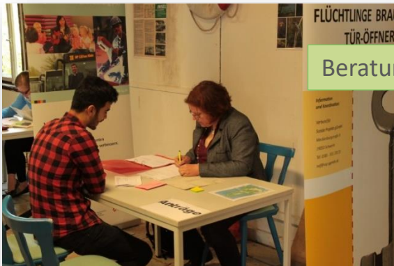
Beratung und Coaching