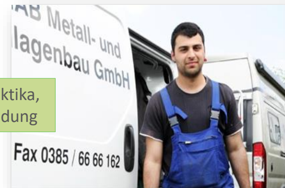
Vermittlung in Praktika, Arbeit oder Ausbildung